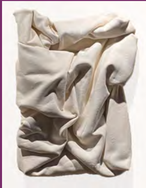
subtile peace inside 2021 Molton 81 x 56 x 17 cm

Studium an der Akademie Faber-Castell in Stein, zahlreiche Ausstellungen u. a. Herz Jesu Kirche Nürnberg. Sie lebt und arbeitet in Peterskirchen.