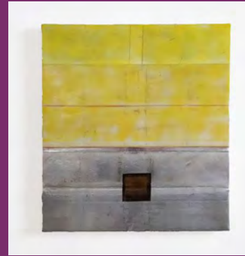
Gelb 2010 Enkaustik mit Blattmetall auf Holz 70 x 62 x 3 cm