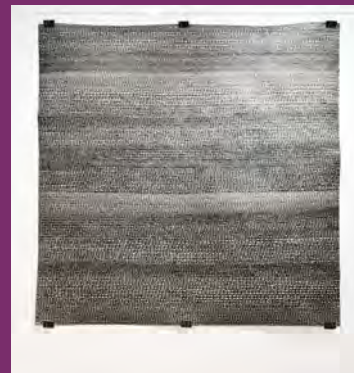
o. T. 2019 ink on Paper 150 x 150 cm

Studium Bildende Kunst an der Akademie Faber-Castell in Stein, Meisterklasse von M. Kronberger, R. Viva und R. Voss. Er lebt und arbeitet in Peterskirchen.