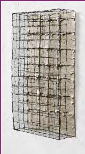
o. T. 2021 Draht, Japanpapier 59 x 31,5 x 11,5 cm

Die Künstlerin widmet sich seit 2001 der freien bildhauerischen Tätigkeit. Ihre Ausbildung erhielt sie bei C. Demenat und G. Drescher sowie an der Berufsfachschule für Bildende Kunst in München. Sie ist Dozentin an der Kunstakademie EigenArt Bad Heilbrunn, lebt und arbeitet in München.