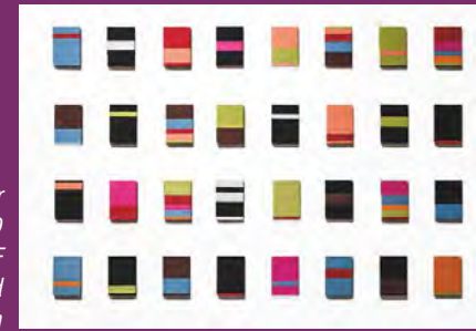
Körper 2005-2019 Garn auf MDF je Bild 15 x 10,5 x 1,4 cm